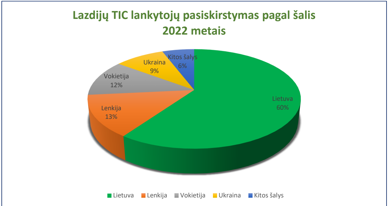
2 diagrama Lazdijų TIC lankytojų pasiskirstymas pagal šalis 2022 metais

Lietuvos statistikos departamentas skelbia, kad 2022 m. šalies apgyvendinimo įstaigos sulaukė 3,8 mln. turistų, arba 1,5 karto daugiau nei 2021 m., iš jų užsieniečių – 1,1 mln., arba 2,3 karto daugiau (3 diagrama).